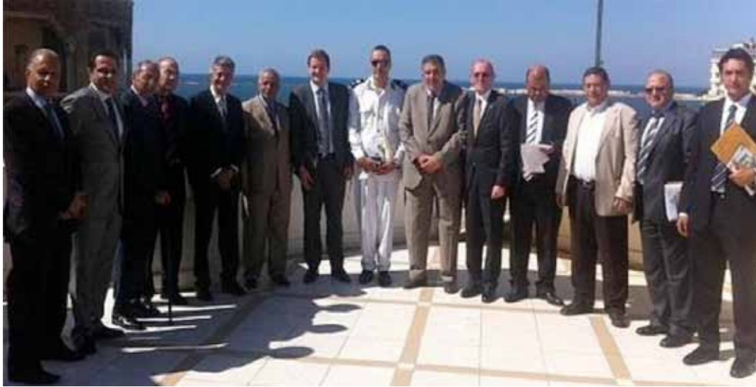
الشعبه تشارك في لقاء منظمة النقل الدولي الطرقي IRU و الإتحاد العام الغرف التجاريه لمناقشه تطبيق إتفاقيه الأمم المتحده النقل الدولي TIR

الاتفاقيه الجمركيه الTIR الخاصه بنقل الحاويات بين الدول بدون فتح الحاويات تمهيدا للانضمام إلى اتفاقيه