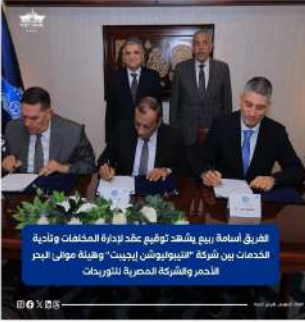
الفريق أسامة ربيع يشهد توقيع عقد لإدارة المخلفات وتوحيد الخدمات بين شركة "انتببولوشن إيجبت" وهيئة موانئ البحر الأحمر وشركة المصرية للتوريدات

والشركة المصرية للتوريدات والأشغال البحرية. جدير بالذكر، أن شركة "انتببولوشن إيجبت" هي شركة مساهمة جديدة بالشراكة بين هيئة قناة السويس ممثلة في كل من شركة القناة للحبال وشركة ترسانة السويس البحرية (من الشركات التابعة للهيئة)، وشركة Antipollution اليونانية والسيد إريك أنم رجل الأعمال المصري اليوناني لإضافة خدمة جديدة لجمع المخلفات الصلبة والسائلة ضمن الخدمات اللوجيستية المقدمة للسفن العابرة للقناة.