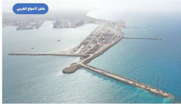
حاجز الأمواج الغربي

مشروع إنشاء حاجز أمواج ميناء الإسكندرية الكبير حيث يتم تنفيذ حاجز ميناء الإسكندرية الكبير بعدد خمس حاجز في ضوء توجيهات فخامة الرئيس عبدالفتاح السيسي رئيس الجمهورية بتطوير كافة الموانئ المصرية لتصبح مركزا للتجارة العالمية واللوجيستيات وحيث يأتي تنفيذ هذا المشروع في إطار مشروع ميناء الإسكندرية الكبير وقد بلغت النسبة الإجمالية لتنفيذ الحواجز ١٧% إذ تم الانتهاء من ١٦% من الحاجز الشرقي و ٢٢% من الحاجز الشمالي و ٢٠% من الحاجز الغربي وجرى البدء في تنفيذ الحاجزين الأوسط والجنوبي حيث يصل إجمالي أطول الحواجز الخمس إلى حوالي ٧ كم طولي