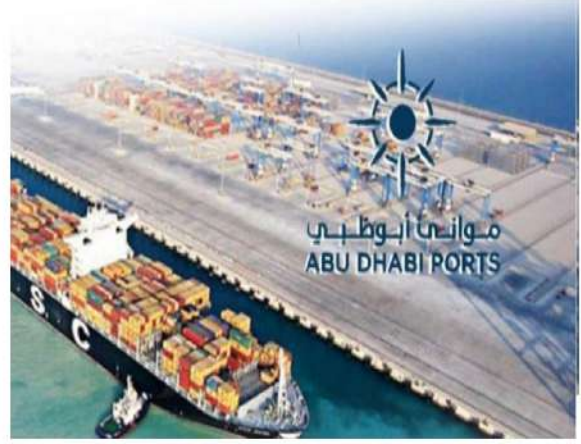
موانئ أبوظبي ABU DHABI PORTS

مجموعة موانئ أبوظبي : ارتفاع عدد السفن التي تمتلكها إلى ٢٢٦ سفينة خلال ٢٠٢٣