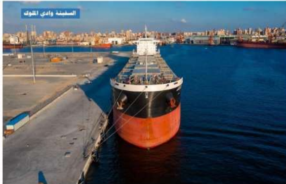
السفينة وادي الخوك

ومع عدم الإخلال بأي عقوبة أشد، منصوص عليها في قانون العقوبات أو في أي قانون آخر، يُعاقب بالعقوبة المنصوص عليها في الفقرة السابقة كل مالك أو مستقل أو مجهزة أو زيان أخفى أو شوه أو طمس أو محا أي بيان من البيانات المنصوص عليها في المادة (٨) من هذا القانون "القانون رقم ٨٤ لسنة ١٩٤٩ بشأن تسجيل السفن التجارية" إلا إذا كان ذلك بقصد التخلص من الموقع في أسر العدو.